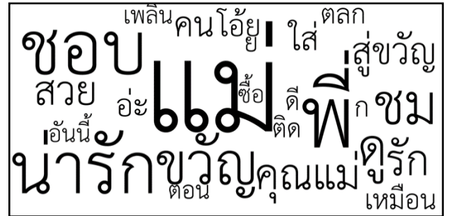
ภาพรวมของการใช้คำว่า “แม่” ในช่องความคิดเห็นของช่อง Praew Magazine