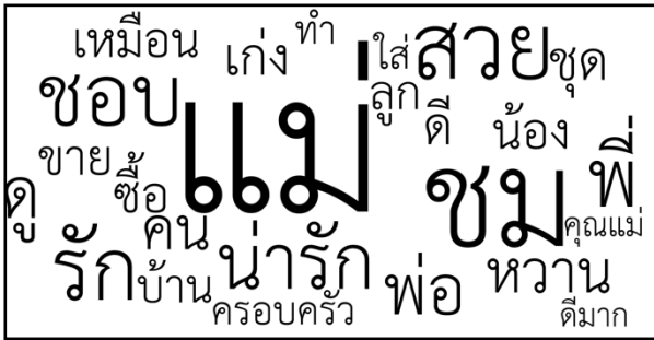
ภาพรวมของการใช้คำว่า “แม่” ในช่องความคิดเห็นของช่อง L'Officiel