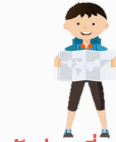
นักท่องเที่ยวไทย

การท่องเที่ยวไทยกำลังเป็นเศรษฐกิจขาขึ้น ในปี 2561 ที่ผ่านมาประเทศไทยมีรายได้จากนักท่องเที่ยวต่างชาติกว่า 2.01 ล้านล้านบาท สูงเป็นลำดับที่ 4 ของโลก มีนักท่องเที่ยวต่างชาติมาเที่ยวเมืองไทยกว่า 38.27 ล้านคน และมีจำนวนนักท่องเที่ยวไทยเที่ยวไทยกว่า 164.24 ล้านคนครึ่ง สร้างรายได้ 1.07 ล้านล้านบาท รวมรายได้จากการท่องเที่ยวมีมูลค่ากว่า 3,08 ล้านบาท (กระทรวงการท่องเที่ยวและกีฬา, 2562)